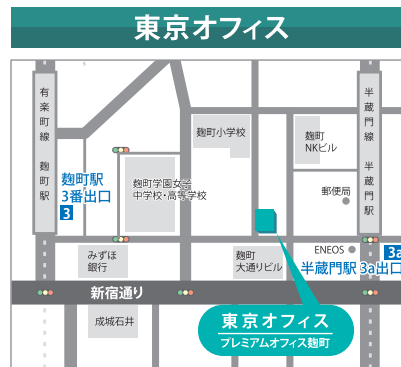
〒102-0083 東京都千代田区麹町2丁目10-2 プレミアムオフィス麹町 TEL.03-3288-7055