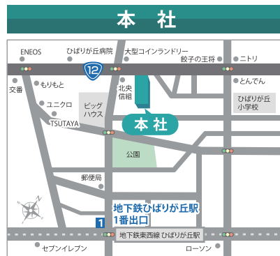
〒004-0052 札幌市厚別区厚別中央 2条3丁目5-11 TEL.011-896-7571