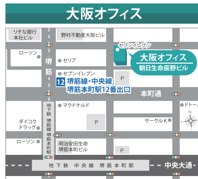
〒541-0052 大阪市中央区安土町1丁目6-14 朝日生命辰野ビル TEL.06-6267-2821